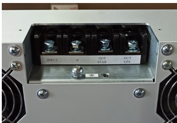
Рис.1.Клеммник подключения сети и нагрузки

В этом режиме к аппарату не нужно подключать аккумуляторные батареи (АКБ). Вся нагрузка подключается на клемму обозначенную как «OUT СТАВ (Выход СТ)» (Рис.1).