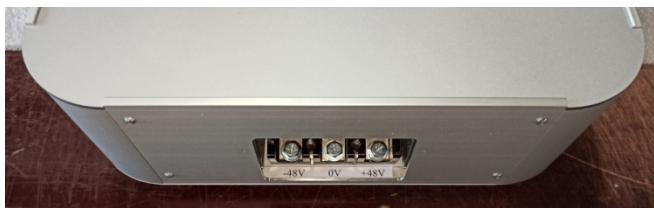
Рис.4. Клеммник для подключения АКБ.

В нижней части корпуса расположен клеммник для подключения аккумуляторных батарей (Рис.4).